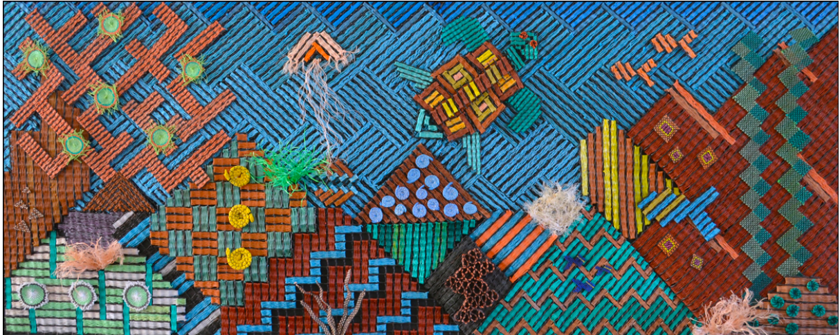
Coral Reef, Tissage corde de pêche en nylon sur poches à huîtres, 202 x 87 cm, 2020

« L'artiste franco-américaine Stéphanie Lerner est une grande voyageuse et c'est comme ça qu'elle a pris conscience de la pollution des océans... Un jour elle a réalisé qu'elle trouvait de plus en plus de déchets plastique et de moins en moins de bois flotté !