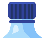
bouchon en plastique